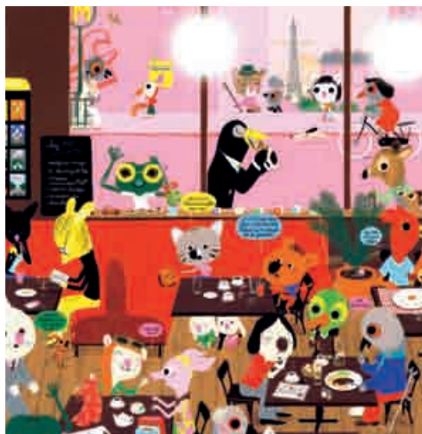
Mouk, Albin Michel

Les passerelles entre littérature de jeunesse et cinéma sont multiples : les adaptations d'albums ou de romans nourrissent les